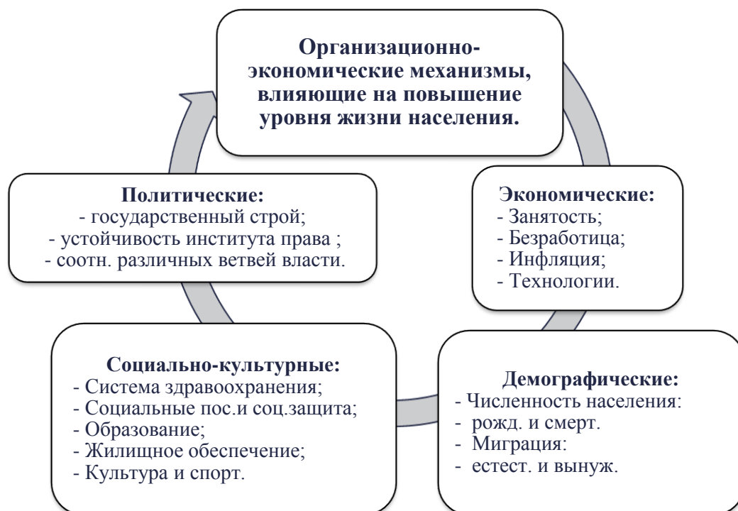
Рисунок 1. Организационно-экономические механизмы, влияющие на повышение уровня жизни населения (построен автором)

экономической жизни населения, достаточно много. Их содержание отображено на рисунке 1.